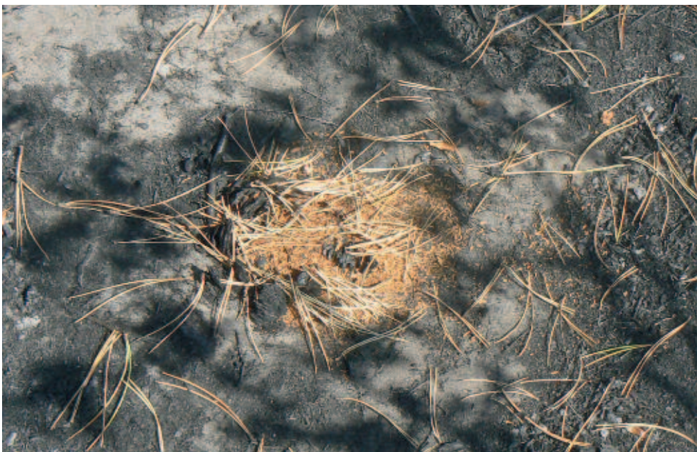
Foto 2. Voorbeeld van een satellietnestje dat direct na de brand werd gesticht.

gering verlies van nesten op. De omgeving van de nesten waren groene eilandjes in een stuivende zandvlakte, doordat er enkele vierkante meters groen om elk nest was gespaard (foto 3).