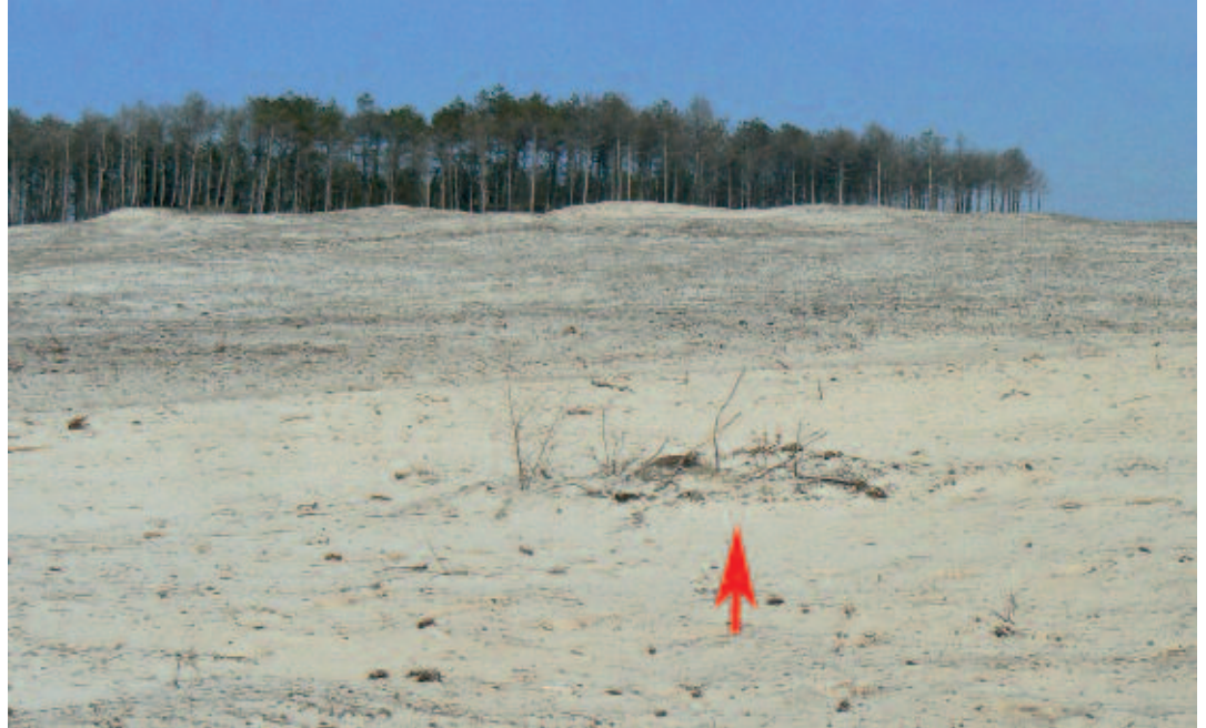
Foto 3. Aanvankelijk weet een Rode bosmiernestpopulatie zich in de zandvlakte te handhaven.

Alle uitgestorven nesten waren grotendeels overstoven (tabel 2). De mieren zijn constant bezig met het openhouden van de nestingen en het herinrichten van het inwendige nest door binnendringend zand, wat optimale thermo- en vochtisolatie verhindert. Deze continue restauratiewerkzaamheden vragen veel energie wat ook ten koste gaat van broedzorg en voedsel vergaren en moet dus vroeg of laat zijn tol gaan eisen.