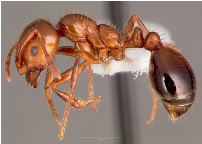
Figuur 1. Major werkster van Solenopsis invicta . Figure 1. Major worker of Solenopsis invicta .

Caraïbische eilanden, Australië, Taiwan, China, Maleisië en de Filipijnen. Solenopsis geminata (Fabricius, 1804) (fig. 2) komt tegenwoordig door introducties op alle continenten (behalve Antarctica) en op zeer veel eilanden tussen de keerkringen voor, ook in de zuidelijke staten van de VS en sporadisch in het Middellandse Zeegebied (Harris zonder jaar). Solenopsis richteri Forel, 1909 is ingevoerd in de zuidelijke staten van de Verenigde Staten, waar deze soort lokaal algemeen is. Door de introductie en uitbreiding van S. invicta in de Verenigde Staten wordt S. richteri juist weer weggeconcentreerd en ook worden er in het