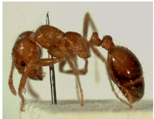
Figuur 3. Major werkster van de in 1966 onderschepte Solenopsis gayi .

Als brandmieren zich ergens vestigen kunnen ze door hun hoge aantallen en opportunistische voedselzoekgedrag invloed hebben op andere