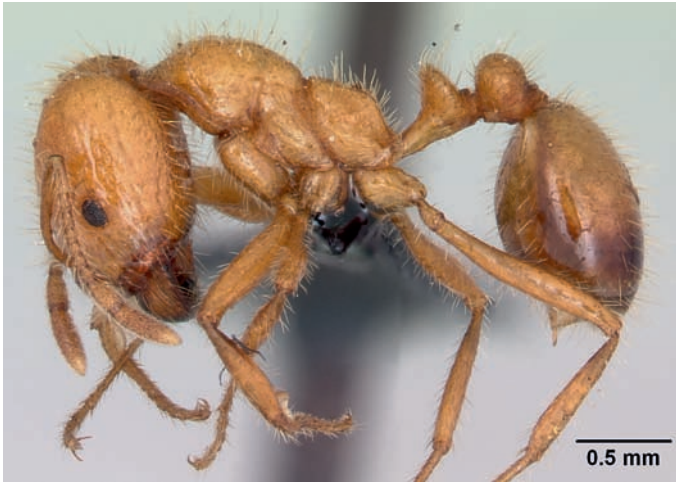
Figuur 2. Major werkster van Solenopsis geminata . Foto April Nobile, www.antweb.org . Figure 2. Major worker of Solenopsis geminata . Photo April Nobile, www.antweb.org .

schadelijkheid van exoten en over de mogelijkheden om schade na introductie te voorkomen. In opdracht van dit team heeft EIS-Nederland een risicoanalyse uitgevoerd voor brandmieren in Nederland (Noordijk 2010). Hier geven wij een overzicht van de belangrijkste bevindingen.